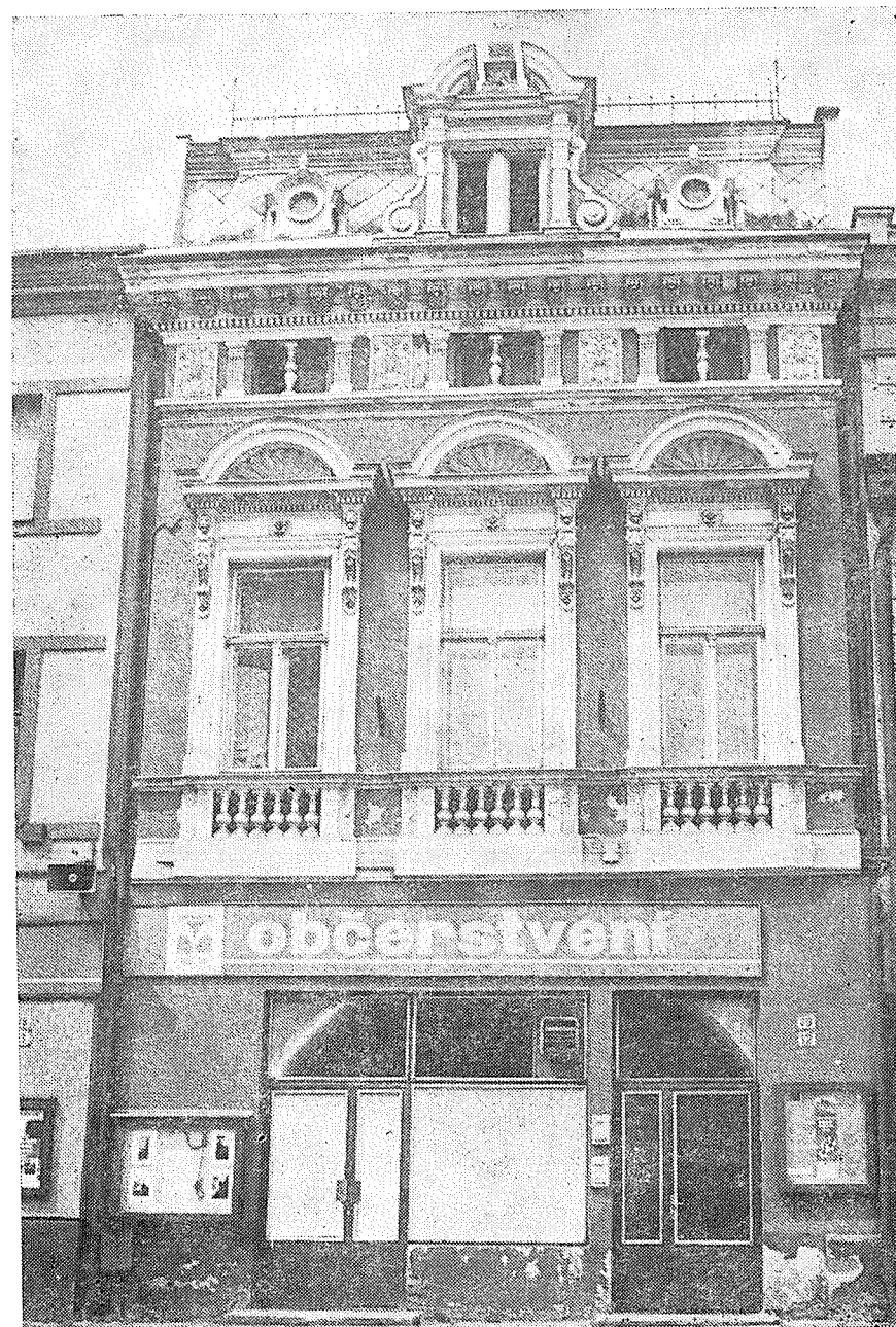
Dům čp. 12 na západní straně náměstí po renovaci. Foto M. Hlubinková 1988.