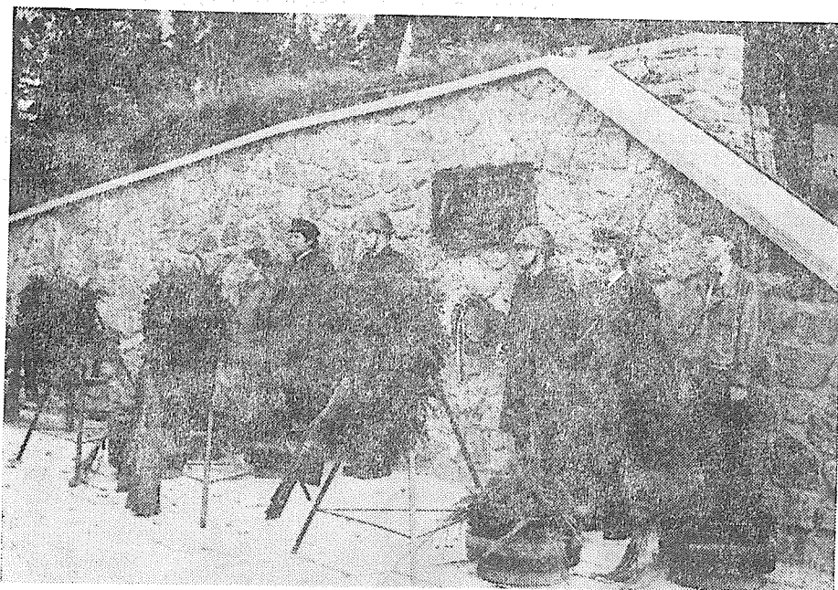
Fotografie Čestmíra Novotného z odhalení pamětní desky obětem fašismu.