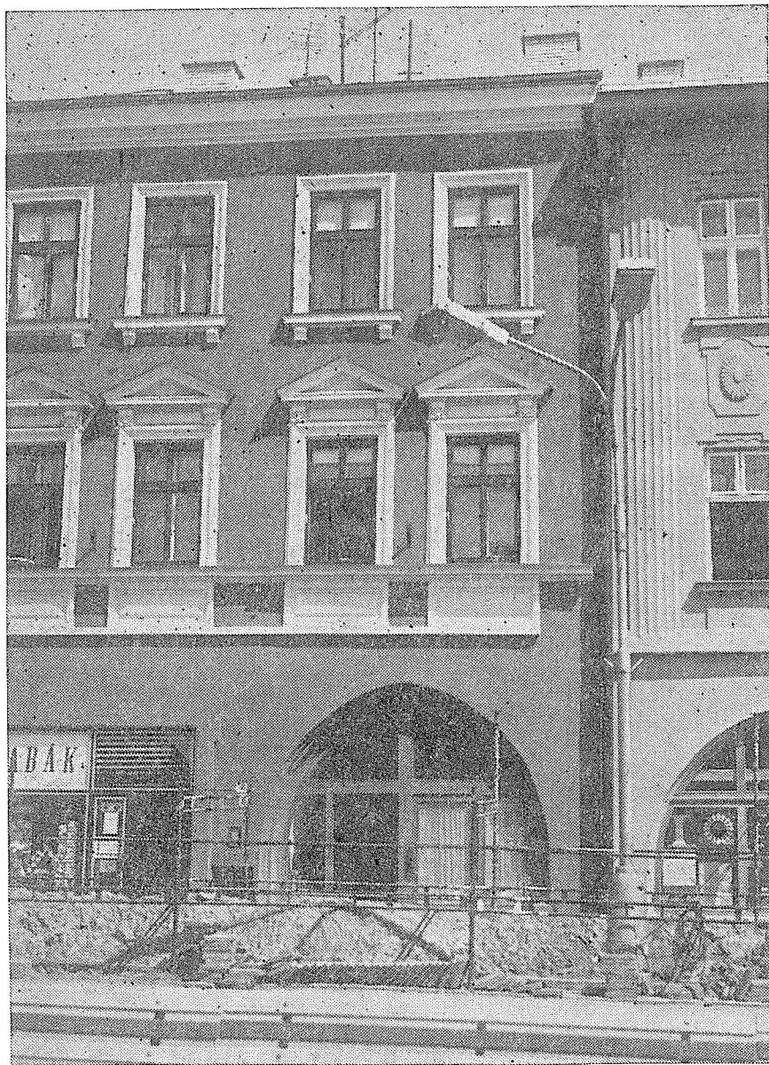
Dům čp. 94 na náměstí po renovaci.