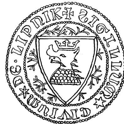
Pečeť města Lipníka z r. 1349.

Velmi krásně zachovaná pečeť ve žlutém vosku, přivěšená na pergamenovém proužku, měří v průměru 51 mm a má uprostřed dolů zašpičatěný trojstranný štít. V něm je zobrazena korunovaná hlava nějakého divokého zvířete, které snad — vzhledem ku hřívě — má býti lvem. Ale Bretholz mohl zcela dobře míti tuto korunovanou hlavu za hlavu kance. Perem kreslená kopie, zhotovená úředníkem archivu prof. Frant. Navrátilem umožňuje lepší představu, kterou by ovšem podal nejuvěrnější fotografický snímek nebo odlietek.