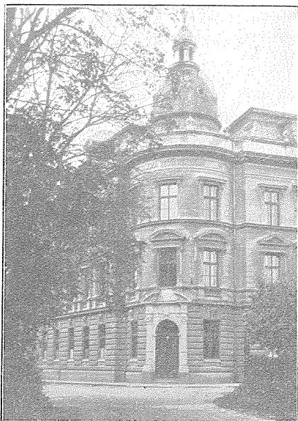
Česká státní reálka v Lipníku n. B.