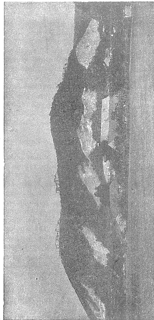
Obr. 10. Hrad Helštýn. — Celkový pohled.

Rytíře nečekaná tato zvěst zhroutila. Snad tušil původce hrozného činu. Před chvílí ho vnadil ještě úsměv děvy cizí, teď klnul vášni liché, litost palčivá mu srdce rozedírá, dvojnásob želi ztráty drahých bytostí, pozdě však. Smrt nevrací své kořisti.