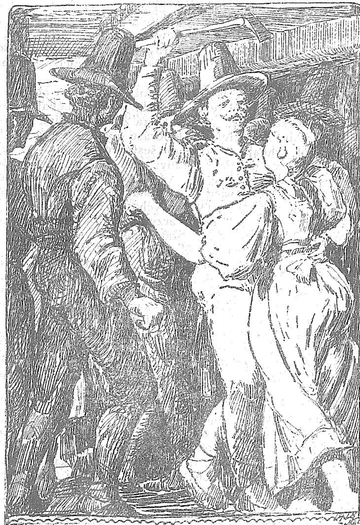
Obr. 7. Ondráš a Juráš ve sviadnovské hospodě.

váženo. Právě, když hošík přišel na svět, spustila prý se nad fojtstvím s nebe ohnivá koule, což bylo lidem všelijak vykládáno a z úkazu toho na budoucí osud chlapce souzeno. Ačkoliv otci, starému Ondrovi, vše na uši se doneslo, ničeho si z toho