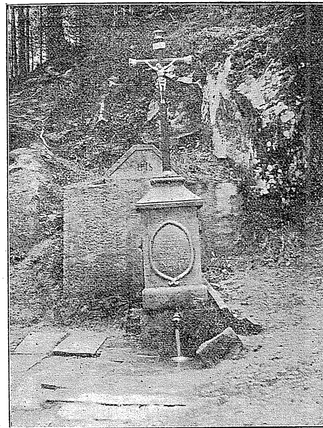
«Svatá Voda» v Zašově u Val. Meziříčí.

rovněž v údolíčku ve stínu dvou lip. Na jedné pověšen obraz sv. Cyrilla a Methoda. Zástupy zbožných Moravců (Lachů) z Lašska moravského a opavského putují sem stále, uctívajíce pramen stejnou důvěrou v její léčivost na přímluvu sv. Věrověstů. Každoročně v oktávě svátku sv. Cyrilla a Methoda vede se k ní ze Slatiny slavný průvod k vykonání pobožnosti. — 5. Mezi touto a Opavou nedaleko Hrabíně, blíž Vel. Polomy vyvívá «svatá voda». Pramen vyzděn ve studánku a zbožná ruka nad ní pořídila dřevěné bednění a při tom na sloupu pověšen obraz matky Boží od jara do podzimku cvěčený. Lid na Opavsku má ji ve veliké úctě, zbožní lidé z daleka přicházejí pro vodu její, připisující jí léčivé účinky na přímluvu Matky Boží a sv. Věrověstů. — 6. Poslední «svatou vodu» nalezl jsem u Vel. Glogova mezi Bavorovem a Opolí, kde jí stejnou úctou navštěvuje polský lid hroního Slezka pruského a nepochybují, že takových pramenů, použitých sv. Cyrilem a Methodem ke křtu získaných duší pro nebe, se tu také několik najde v čase příštím.