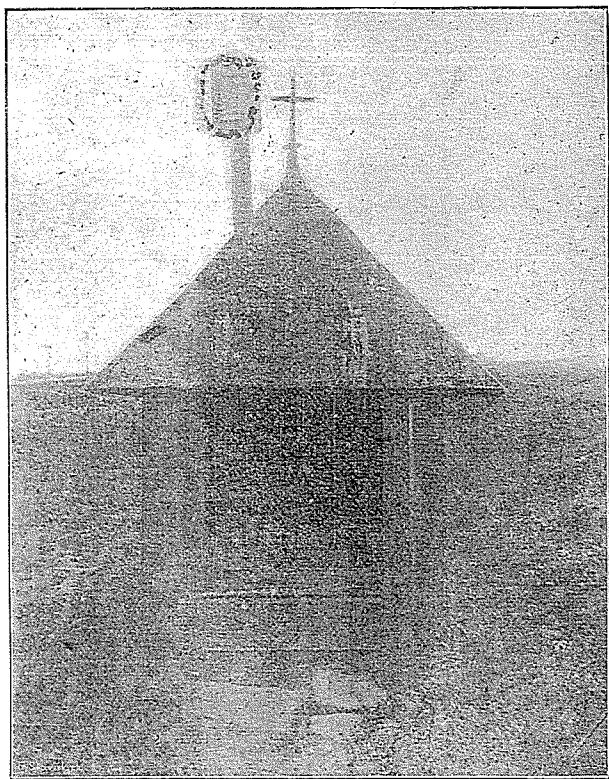
«Svatá Voda» u Velké Polomy ku Hrabyni.

Záhorská Kronika. Čís. 7. vyjde až v září pro daleké cestý, které vykonám ve stopě sv. Cyrilla a Methoda za hranicemi k ilustrování III. dílu: «Po stopách sv. Cyrilla a Methoda Evropou». Poslední číslo v prosinci vyjde naposled na doplatky. Dělá to veliké starosti. Z mnoha stran nedostal jsem z nákladu ničeho. Výprava každého výtisku stojí 3 hal., čtvrtý je na poštovní řízení a 10% poplatek rozdavačům v dědinách. Při svědomitém zasílání doplatek zůstalo by několik haléřů. Je to tak laciné, poněvadž všechno sám obstarávám zdarma. Od ledna 1910 bude se tisknout Z. Kr. jen pro ty v dědinách, kteří se v listopadu přihlásí a v lednu dají předplatné a sice 4 hal. na vydávání a 1 hal. roznašečům, tedy za 10 šísel 25 dvouhaléřů na celý rok. Jen v Bránkách, Hranicích a Lipníku na doplatek 5 hal. Vlasteneckým krtkům toto: Nebořte, na čem jste nestavěli! Za dobrotivá slova povzbuzující z mnoha stran děkuji vroucně, jsou ona jedinou útěchou v tomto klopotném snažení.