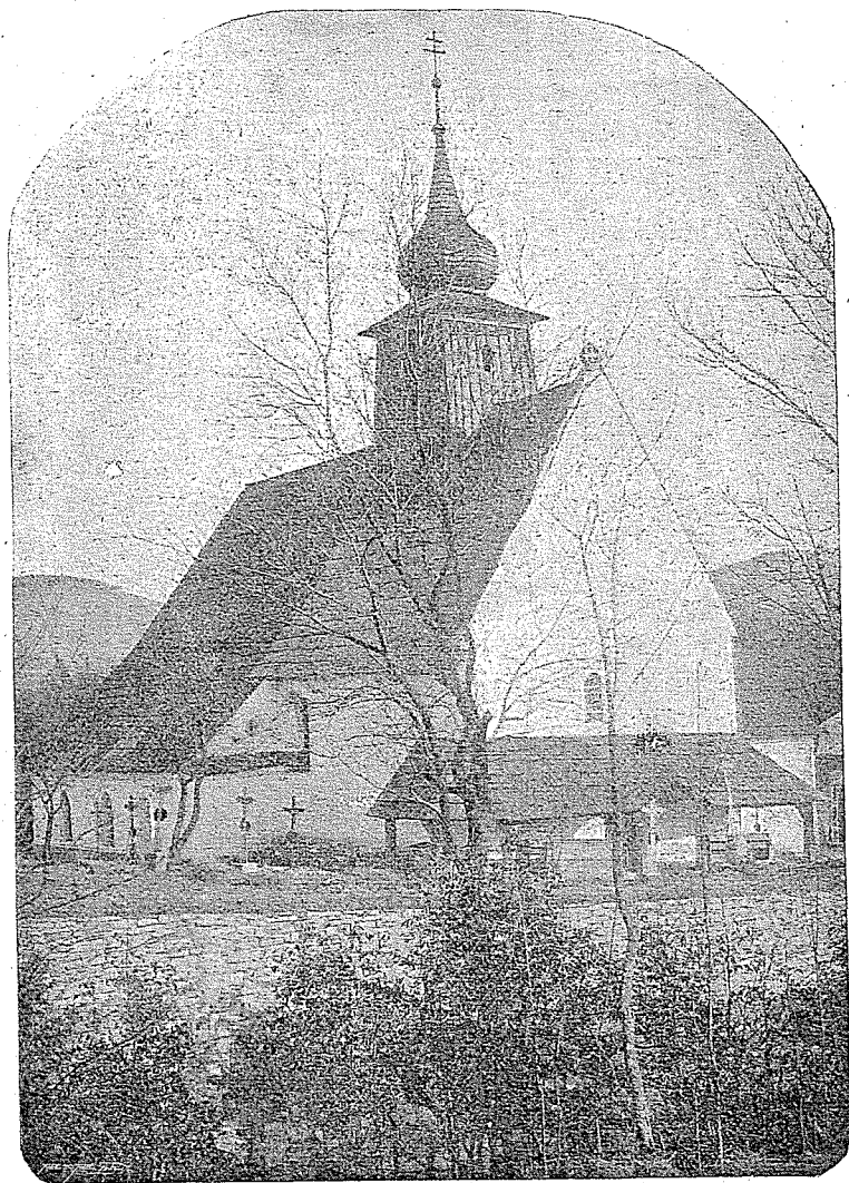
⌘Kostel v Rybí (Morava).

vého, při ní stojí nízký kamenný kříž podobný vyobrazeným. Těž jiný stojí v pěkné zahrádce u farního kostela Matky Boží v Bavorově. Celá řada, dle zpráv, stojí jich k Opolí. Od Uh. Hradiště až do Opolí tyto památky po činnosti