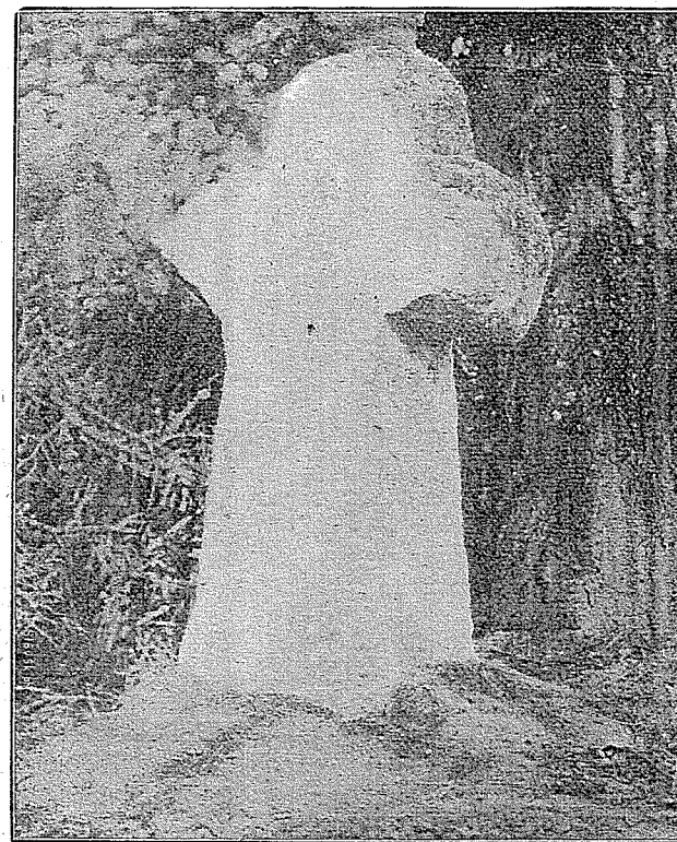
Kříž v Budišovicích.