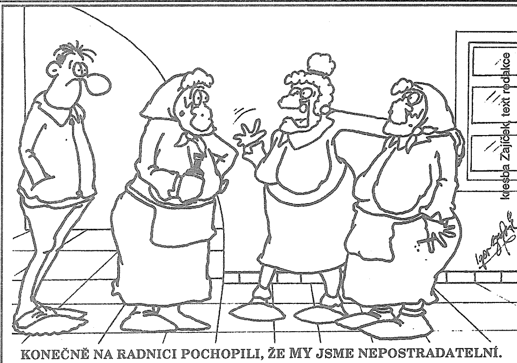
KONEČNĚ NA RADNICI POCHOPILI, ŽE MY JSME NEPOSTRADATELNÍ.