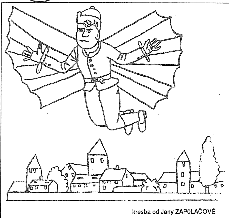
kresba od Jany ZAPOLAČOVÉ

V 5. čísle PŘEHLEDU SI MŮŽETE PŘEČÍST důležité informace z Finačního úřadu str. 3 o rozpočtu města str. 4 - 5 nová rubrika Přehledu INFORMÁTOR str. 6