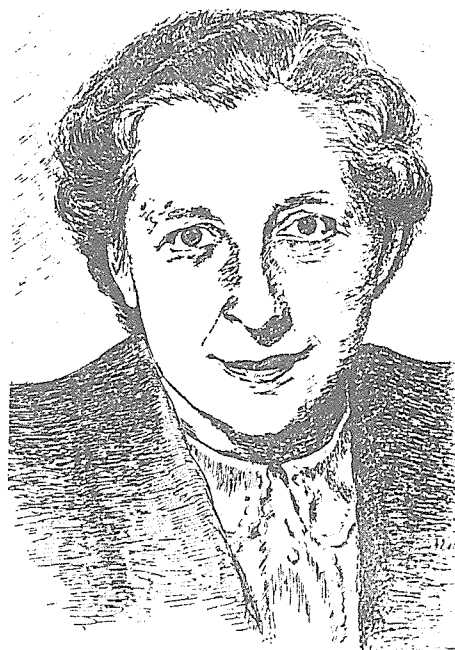
Dr. Milada Horáková