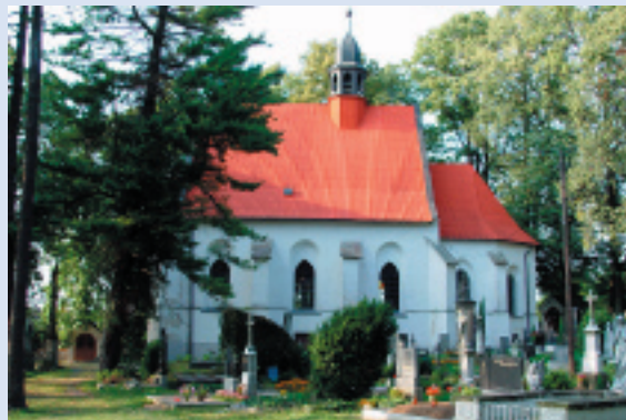
Hřbitovní kostel Narození Panny Marie zvaný „Kostelíček“

V lázních naleznete oázu klidu, načerpáte novou energii a upevníte své zdraví. V moderních sanatoriích se pomocí nejmodernějších léčebných metod úspěšně léčí srdeční a cévní onemocnění a poruchy pohybového aparátu. Ochutnat můžete výbornou minerální vodu. http://sweb.cz/outeplice , www.lazne-teplice.cz