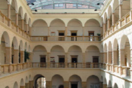
Renesanční arkádové nádvoří zámku