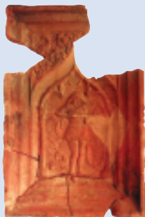
Pozdněgotická kachle ze zámku v Hranicích

Pamětní deska popravy v roce 1627, mírně vpravo před kostelem , připomíná popravu hraničských měšťanů za účast na protihabsburském povstání.