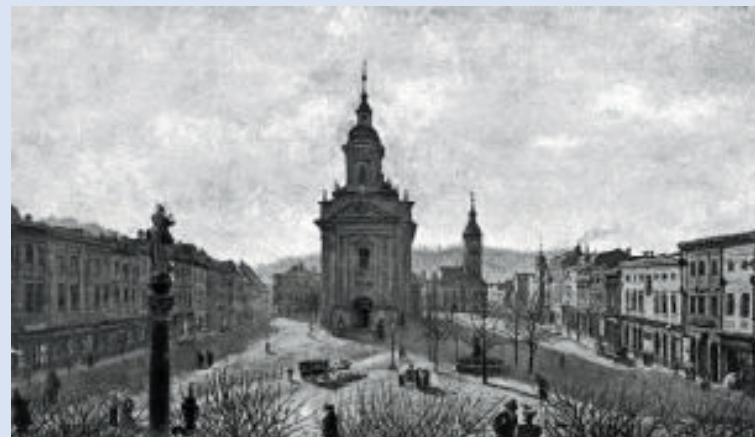
Jan Pinkava: Dnešní Masarykovo náměstí, pohlednice podle akvarelu, 1903