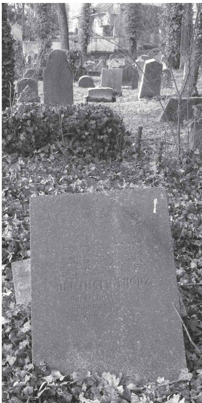
Židovský hřbitov v Hranicích, náhrobek Bertholda Thorže.