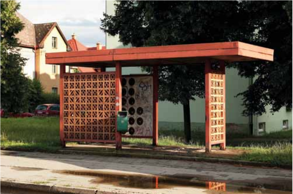
Autobusová zastávka MHD, Purgšova, foto 2012