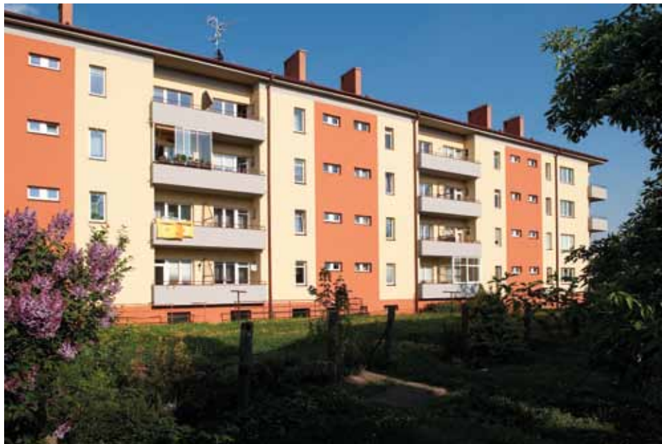
Jan Peterka: Činžovní dům, 1946, Třída 1. máje 1279–1281, foto 2012