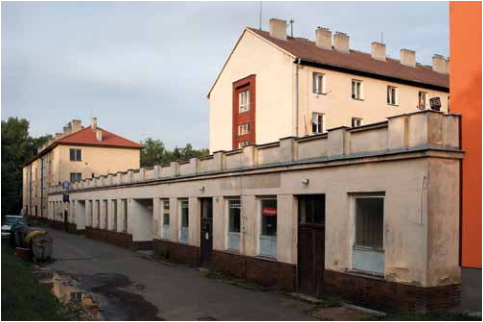
Cementářenské sídliště, dříve CVH, 1955, Belotínská 1295, 1297, foto 2012