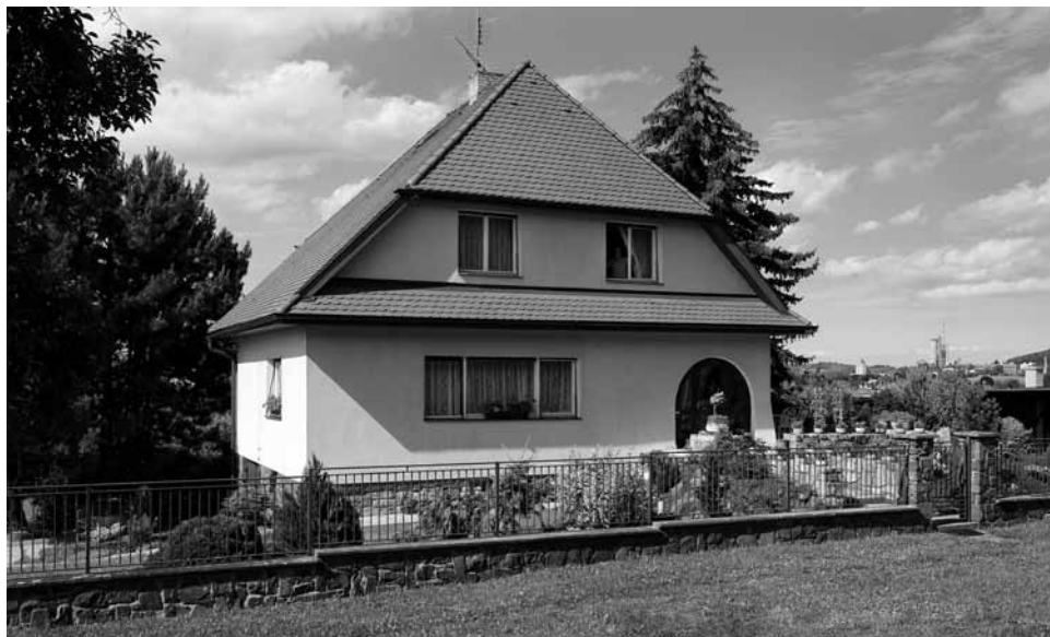
Lubomír Šlapeta: Rodinný dům Augustina Frice, Pod Bílým kamenem 282, 1939–1948, foto 2011

mene, který je dnes užíván jako garáže a ve svahu nad touto plánovanou ústřední teplárnou byl pro zaměstnance lázní vystavěn třípodlažní bytový dům s výraznou předsaženou pultovou střešou [1].