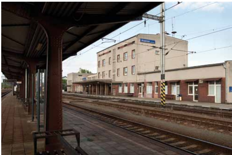
Josef Danda – Jiří Žalman: Nádražní budova Hranice na Moravě-sever, 1938, 1946–1948, (pohled od kolejíště), foto 2012