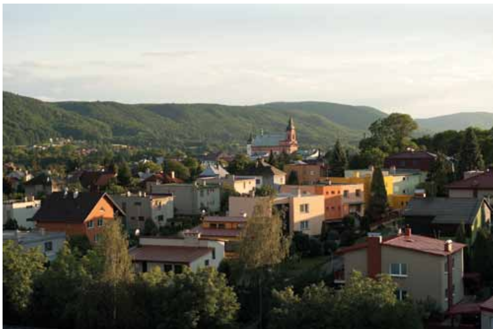
Sklený kopec, zóna pro individuální a řadovou výstavbu, rodinné domy z 1. pol. 70. let 20. století, foto 2012