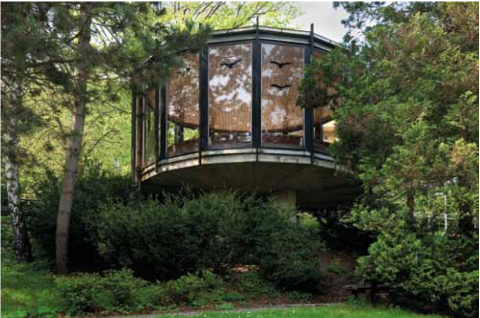
Miroslav Vysín: Autobusová zastávka, 1973, Třída Generála Svobody, foto 2010