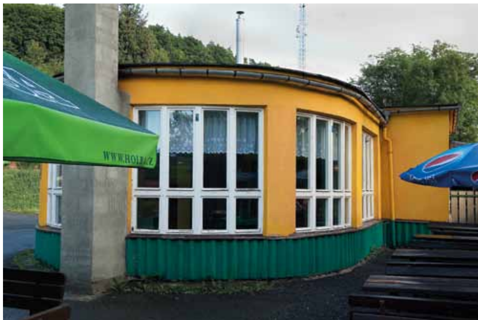
Autocamping, přízemní kruhová stavba jídelny, 1961, foto 2012