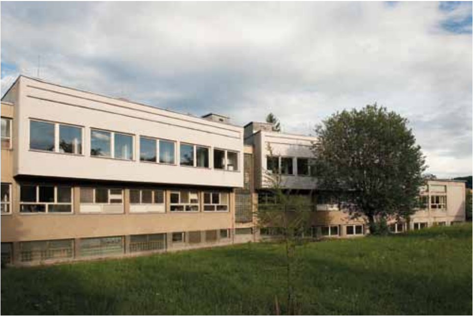
Karel Typovský: Průmyslová škola stavebních hmot, 1959–1961, Studentská 1384, foto 2012