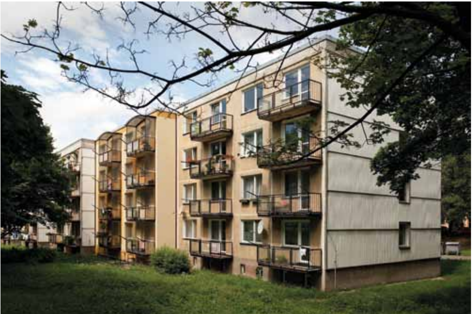
Panelový dům, tzv. „Harmonika“, 1969–1972, sídliště Hromůvka, Zborovská 1505–1511, foto 2012