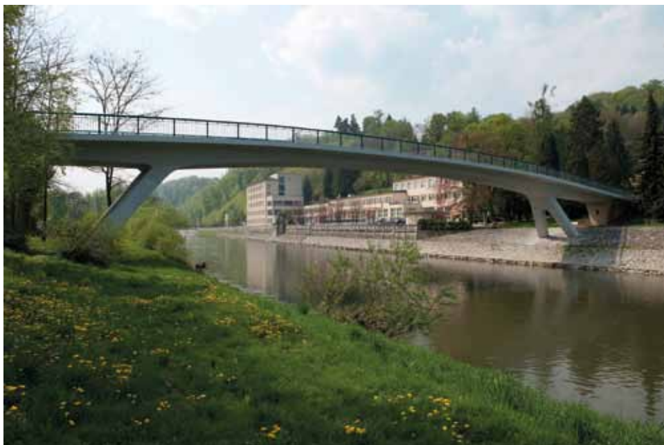
Antonín Pešina: Lávka pro pěší, Teplice nad Bečvou, 1965–1967, foto 2012