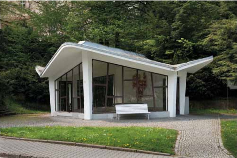
Autor a rok neznámi: Jurikův pramen, Teplice nad Bečvou, foto 2012