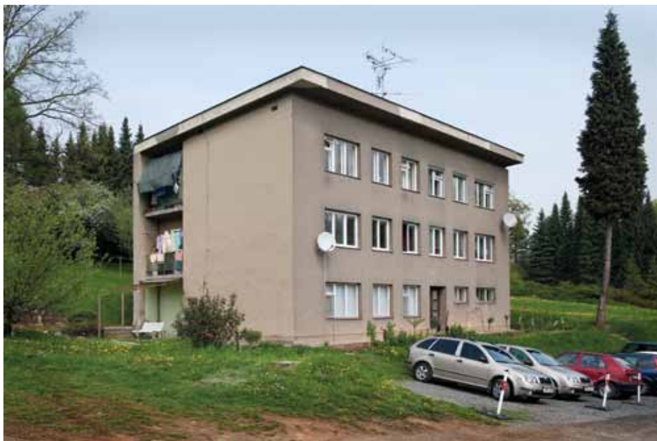
Oskar a Elly Olárovi (?): Bytový dům pro zaměstnance lázní, 1947 (?), Teplice nad Bečvou 72, foto 2012