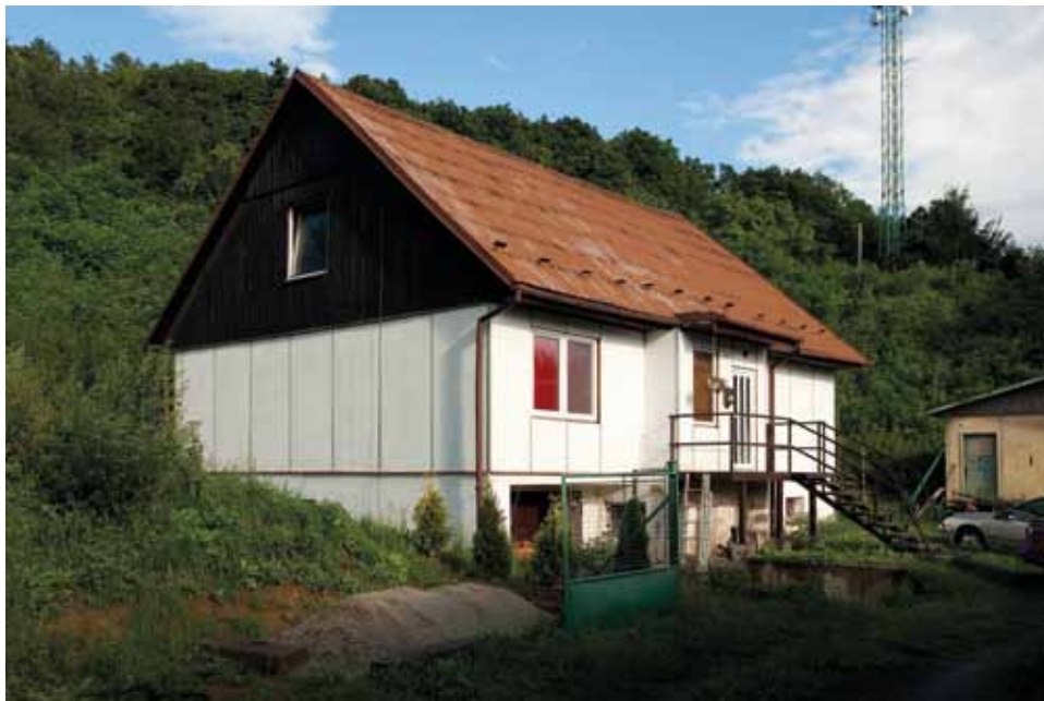
Typový řadový dům Okal, Pod Hůrkou 2103, foto 2012