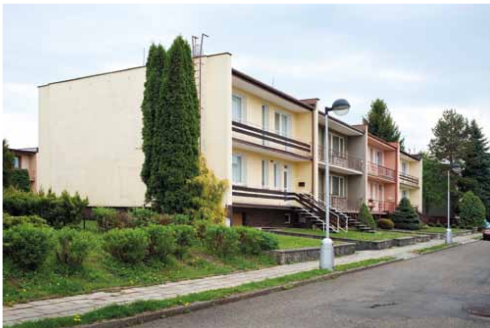
Řadové rodinné domy, kolem 1973, Sklený kopec 1681-1683, foto 2012