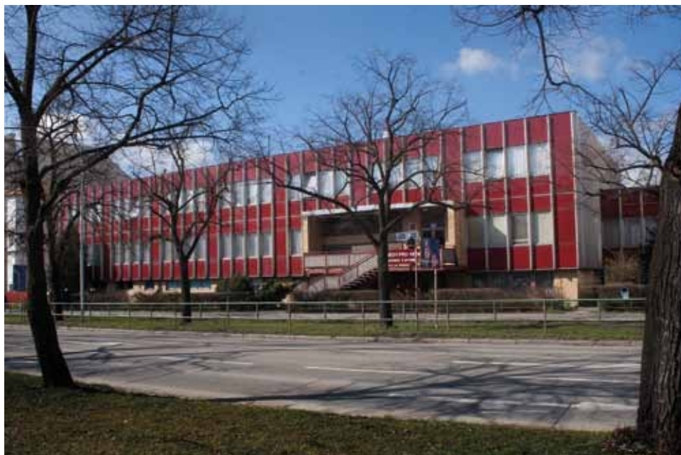
Tzv. „Červená jídelna“, Třída 1. máje 358, foto 2008