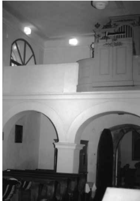
Pohled na kůr, 18. dubna 1998

V polovině 19. století tak byla na území drahotušské farnosti dokončena reforma farní organizace připravovaná od poloviny 18. století. Po několika staletích byla opět stálá duchovní správa u všech tří kostelů na Drahotušsku. Ve Středolesí vzniklo dokonce nové beneficum. Tento stav zůstal nezměněn [5] až do poloviny 20. století. Expozitura drahotušské fary v Podhoří byla zrušena v roce 1946 a kostel byl