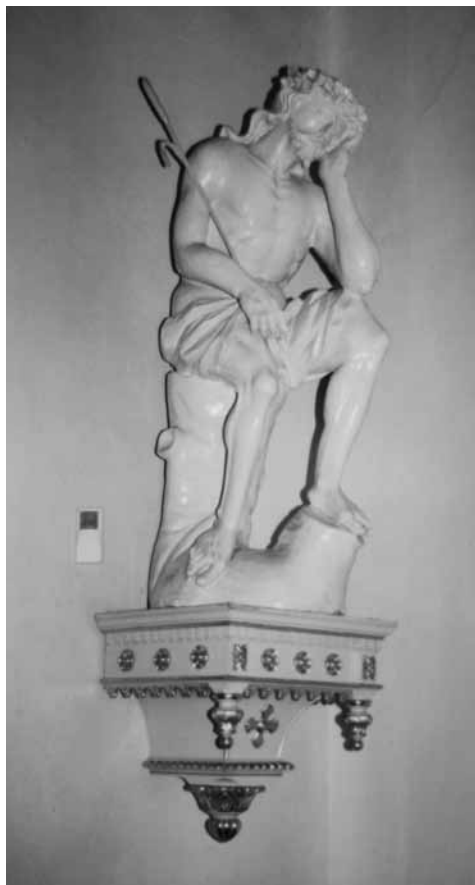
Plastika na epištolní straně vítězného oblouku, 18. 4. 1998

Boční oltář zasvěcený Panně Marii Lurdské byl zhotoven roku 1884 a umístěn v boční kapli kostela sv. Havla při severní zdi presbytáře [1]. V kapli se až do konce 19. století nacházela i zpovědnice, která byla na počátku 20. století přemístěna do západní části lodi kostela pod kruchtou. První uzavřená zpovědnice byla pořízena pro roce 1662, kdy generální vizitace zjistila nekanonický způsob provádění zpovědi na otevřeném místě. Další záznamy jsou až z roku 1932, kdy nechal místní duchovní správce zhotovit v Lipníku novou zpovědnicí a stará byla vyhozena [2].