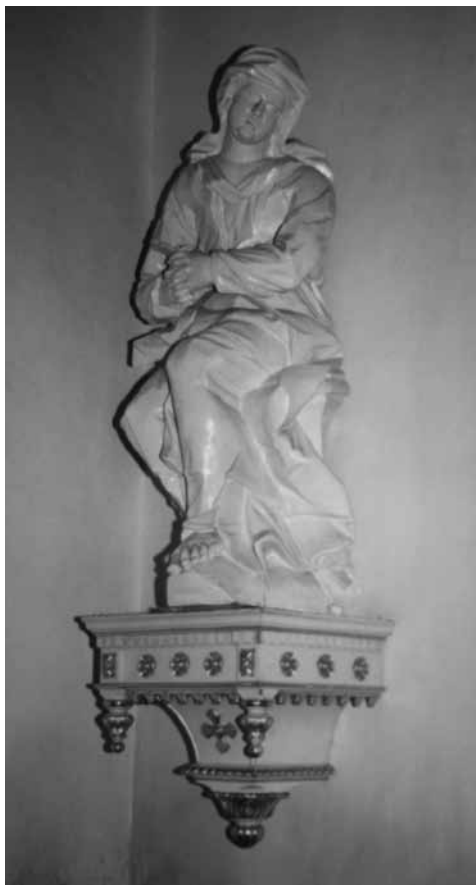
Plastika na evangelní straně vítězného oblouku, 18. 4. 1998