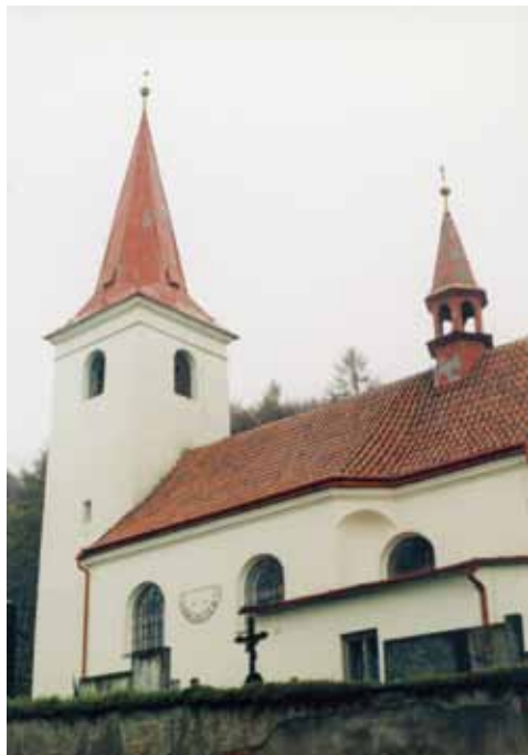
Podhoří, kostel sv. Havla jižní strana