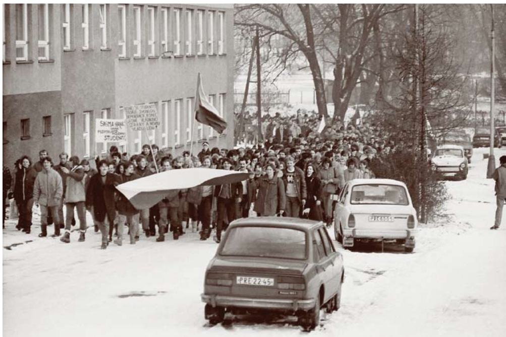
Zaměstnanci podniku Sigma Hranice jdou Jaselskou ulicí na Gottwaldovo náměstí, 27. listopadu 1989

Generální stávká, Gottwaldovo (dnes Masarykovo) náměstí v Hranicích, 27. listopadu 1989