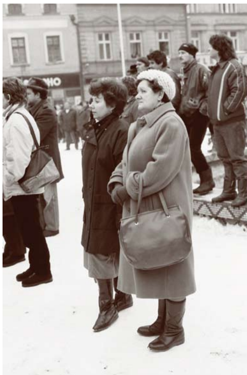
Generální stávká, stávkující – demonstrující – diváci, 27. listopadu 1989

Generální stávká, Gottwaldovo (dnes Masarykovo) náměstí v Hranicích, 27. listopadu 1989