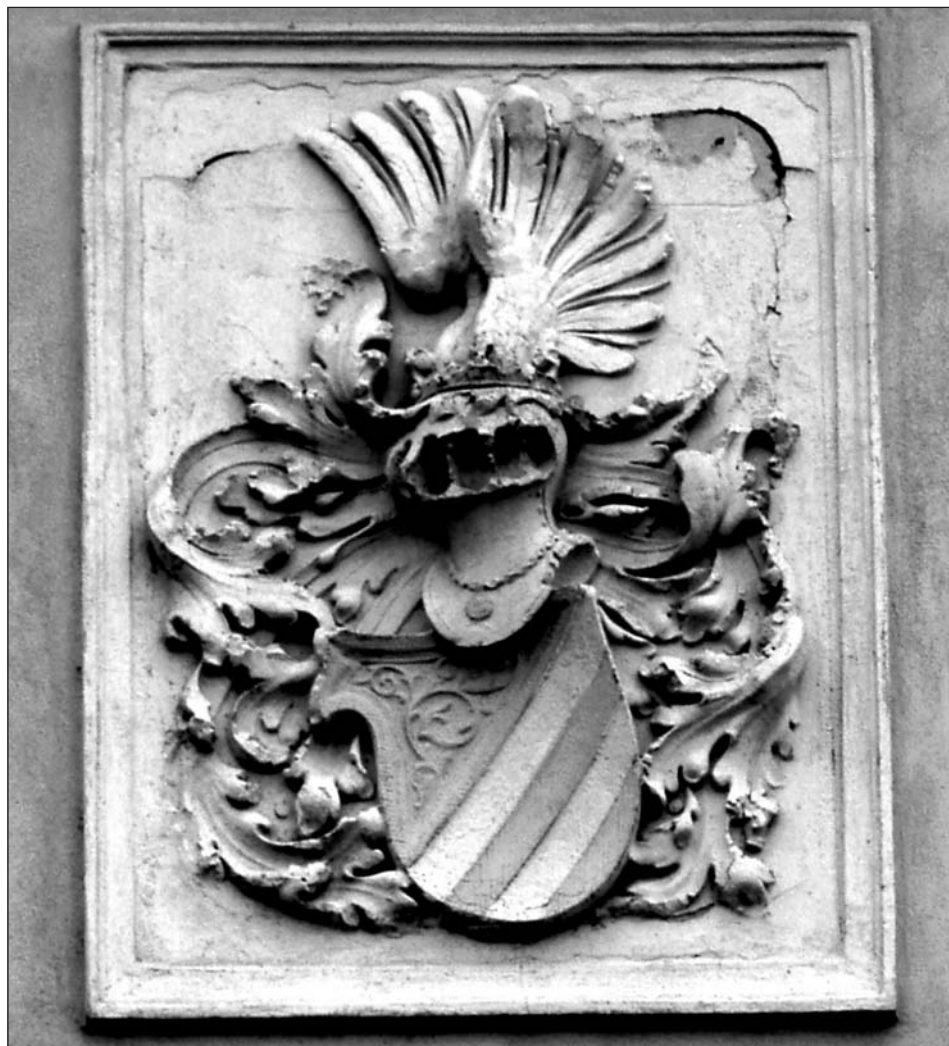
Znak rytířů Nebeských z Vojkovic na vile na Palackého třídě čp. 574 v Nymburce (dnes Základní umělecká škola). Oproti podobě znaku z majestátu z r. 1897 je hlavní odlišností použití turnajského helmu s korunou a dělení štítu, které jde pošikem (nikoli pokosem)!