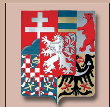
Sřední znak Československé republiky z roku 1920