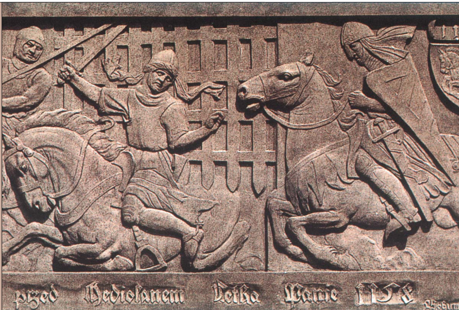
Figura lva se na mincích knížat z rodu Přemyslovců, kteří vládli v Česku až do roku 1306, objevila již kolem roku 1175. Tento lev byl s příchodem heraldiky umístěn do štítu a stal se znakem české země. Lev tvoří jedno ze dvou nejoblíbenějších znamení staré evropské heraldiky. Tím druhým je orlice, kterou později užívali Přemyslovci jako rodový znak. Někdy v polovině 13. století byl český lev ozvláštěn druhým ocasem, podobně jako orlice ve znaku Svaté říše římské byla obohacena o druhou hlavu. Stříbrný (bílý) dvou-

nijak neidentifikovali. Teprve správní reforma z roku 2000 zavedla v České republice 14 samosprávných krajů, které dostaly své znaky, jež většinou kombinují prvky ze starých zemských znaků a ze znaků krajských měst.