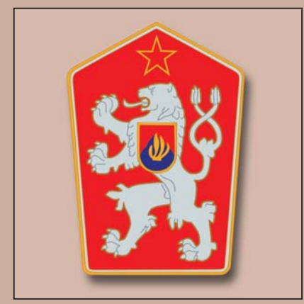
Pokus o změnu heraldických pravidel – znak Československé socialistické republiky, 1960