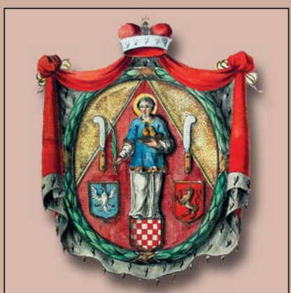
Znak moravského města Hranice, 19. století

ocasý korunovaný lev na červeném štítě se stal znakem Čech a byl kombinován se znaky Moravy, Slezska a Lužice, které tvořily další části Českého království s vlastní samosprávou. Znakem Moravy je stříbrno-červeně šachovaná korunovaná orlice v modrém poli, doložená poprvé kolem roku 1260.