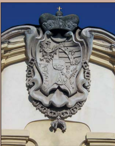
Znak Karla z Liechtensteina, vévody opavského, 1618

rodina Valdštejnů tehdy svůj znak rozdělila na čtvrtiny a do každého pole umístila svůj původní znak lva. V 16. století také narůstá počet osob povýšených panovníkem do šlechtického stavu, jejich znaky pak obsahovaly nejrůznější exotická zvířata či předměty, které měly symbolizovat zaměstnání či jméno toho, kdo byl povýšen.