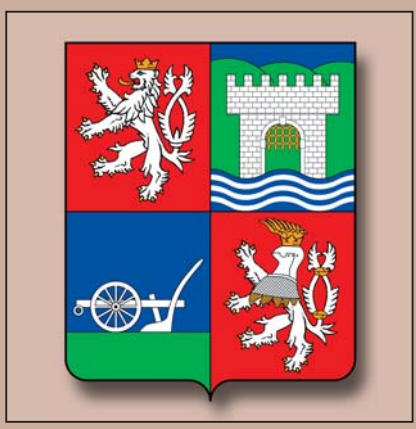
Současný znak Ústeckého kraje, 2000

V roce 1920 přijala Československá republika státní znak, v němž byl lev doplněn o malý štítek se znakem Slovenska, dvojítm křížem na třech pahorcích.