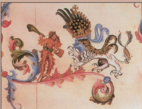
Souboj divého muže s heraldickým lvem, z rukopisu Bible Václava IV. (též Bible Vídeňská, také králova či německá), kolem 1390