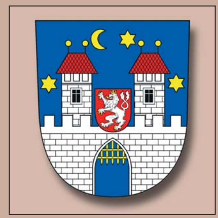
Současný znak jihočeského města Písek, 2000

Stojí za zmínku, že česko-německý nacionální konflikt se v 19. století promítl i do heraldiky, když moravští Němci užívali zlato-červeně šachovanou orlici, kterou Moravě udělil císař Friedrich III. roku 1462, zatímco moravští Češi privilegium římského císaře neuznávali a používali původní stříbrno-červenou orlici. Slezsko, jehož větší část se v 18. století stala součástí německého Pruska, se v průběhu staletí identifikovalo se znakem černé korunované orlice se stříbrnou ozdobnou přezkou na zlatém poli. Slezsko přitom bylo od středověku rozděleno na řadu vévodství, která měla vlastními znaky.