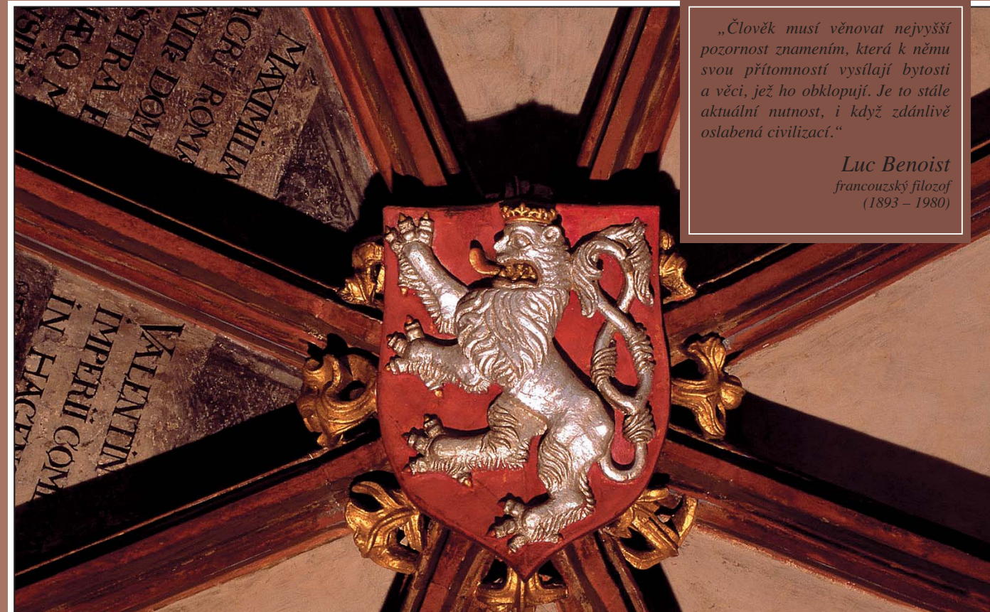
Pozdně gotický znak Českého království z ložnice krále Vladislava na Pražském hradě

„Člověk musí věnovat nejvyšší pozornost znamením, která k němu svou přítomností vysílají bytosti a věci, jež ho obklopují. Je to stále aktuální nutnost, i když zdánlivě oslabená civilizací.“