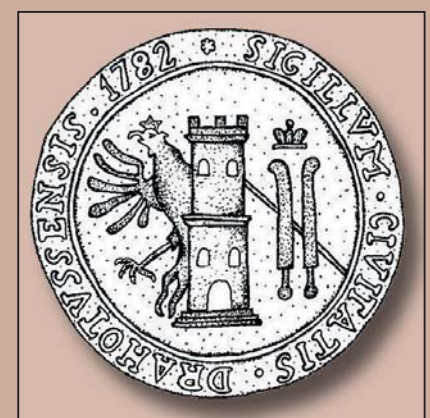
Kresba pečeti moravského městečka Drahotuše, 1782