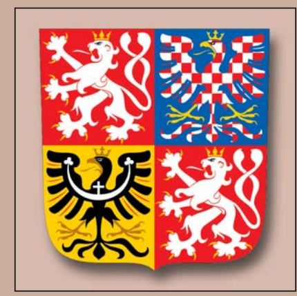
Současný znak České republiky, kresba František Štorm