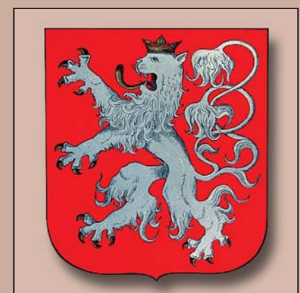
Prozatímní znak Československé republiky z roku 1918

Po staletí byly české země rozděleny na kraje, které ovšem měly pouze správní povahu, a obyvatelé se s nimi