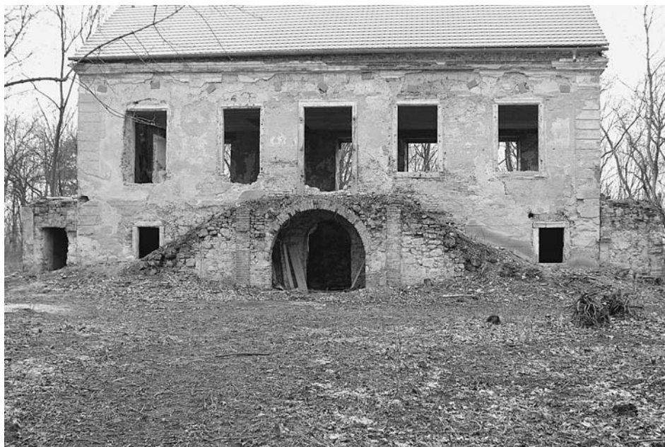
Kdysi skvostný Portzinsel dnes.

řemeslníci a umělci. Jako stavitelé získali od 16. století na Moravě téměř monopolní postavení. Mimořádný cit měli především pro přirozené zakomponování staveb a sídel do krajiny. Zachovaná severoitalská středověká městečka a vesnice kolem Toskánska jsou toho dokladem. Nadání severoitalských stavitelů se v Mikulově projevilo zejména začleněním vápencových návrší do architektury středověkého Loresta. Zásadně změnilo jeho vzhled a založilo originalitu a krásu Mikulova. Většinu architektonických prvků, které dnes vytvářejí charakter a magičnost města, stavitelé s největší pravděpodobností realizovali na příjmu zakázku kardinála Dietrichsteina.