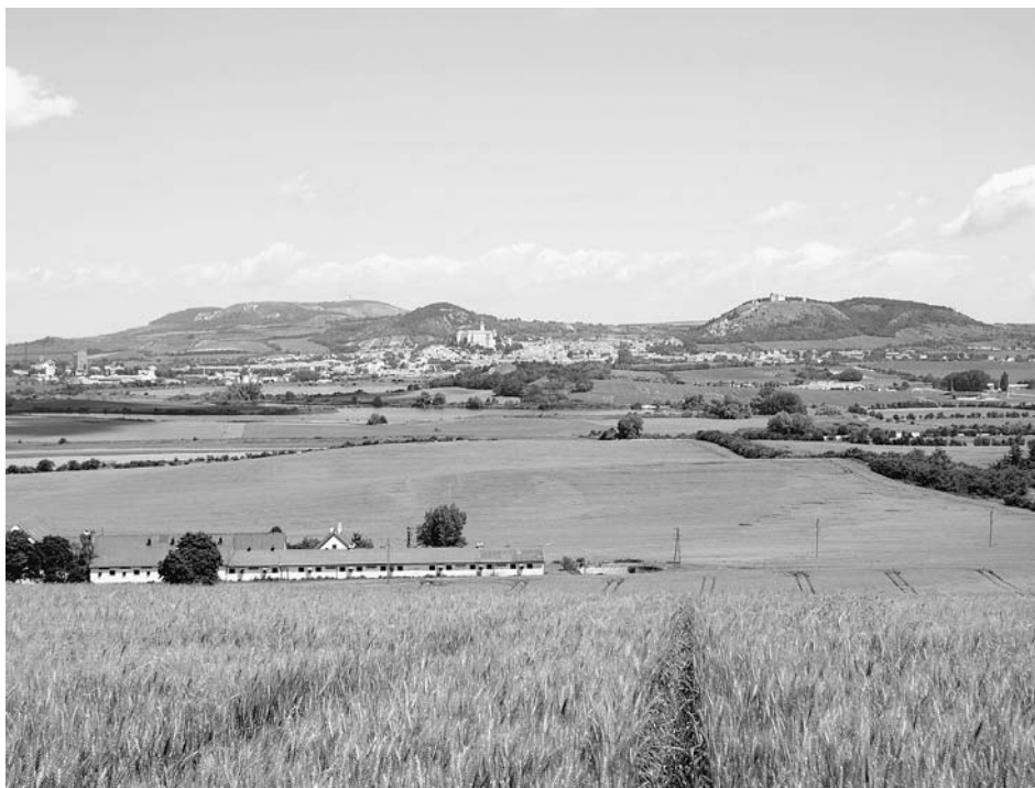
Panorama Mikulova viděné z bývalé knížecí dietrichsteinské obory u obce Klein Schweinbarth.

První svatou horu zbudoval v letech 1481–1486 františkánský mnich Bernardo Caimi v městečku Varallo v údolí řeky Sesia na předhůří severoitalských Alp. Stalo se tak po jeho návratu z Jeruzaléma, kde byl mnoho let kurátorem. Na vysokém kopci nad Varallo nechal vystavět čtyři napodobeniny uctívaných zastavení Svaté země, spojených s Ježíšem Kristem (Nazareth, Bethlehem, Calvario, Hl. Grab). Touto zcela novou originální formou chtěl přiblížit věřícím nejdůležitější okamžiky ze života Krista v daleké Palestině, která byla pro většinu smrtelníků nedostupná.