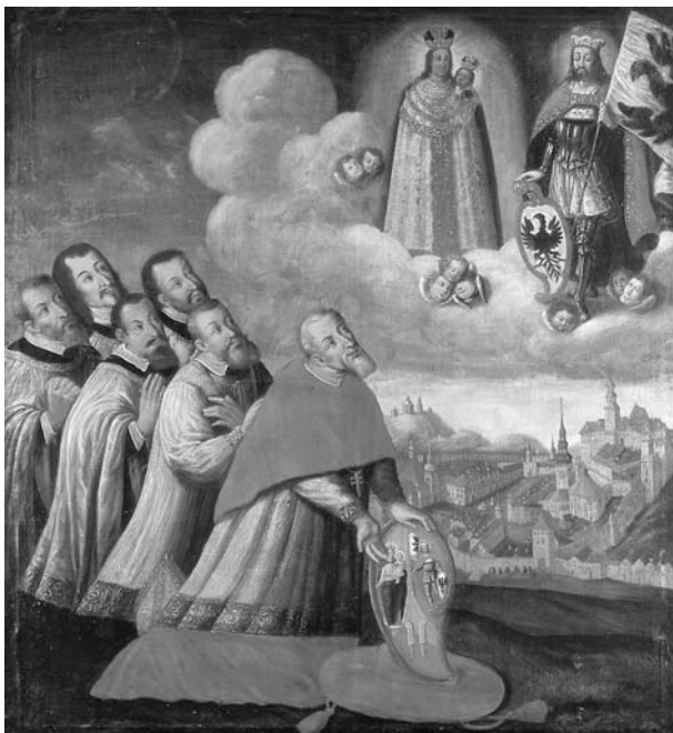
Obraz kardinála Dietrichsteina s kanovníky vypovídá mnohé o významu Františka Dietrichsteina pro své rezidenční město, kterému dal jeho stavební podobu i vtiskl duchovní tvář.

Nejvýraznější úpravy krajiny v okolí Mikulova provedl v duchu pozdní renesance, manýrismu a začínajícího baroka kardinál František Dietrichstein v letech 1611–1636. Radikální urbanistickou přestavbu města spojil s estetickou úpravou příměstské krajiny. Jejím